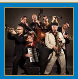
Amsterdam Klezmer Band

Sie haben ihren ganz eigenen Sound, arbeiteten in den letzten Jahren aber auch mit verschiedenen anderen Bands zusammen: Mit der Galata Gypsy Band aus der Türkei, Shantel (Bucovina Club) , C-mon & Kypski und mit dem zeitgenössischen Jazz-Trio Man Bites Dog , um nur einige zu nennen.